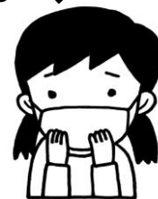
咳エチケットとマスク