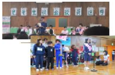
児童生徒会役員選挙