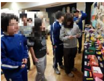
作品展・豊中フェスティバル