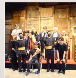
「かすみ荘劇団」公演 in醬油蔵