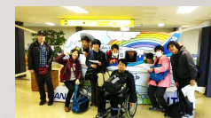
コロナ前のバスステーション前旅行