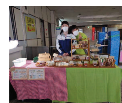
南海千代田駅での販売(喫茶)