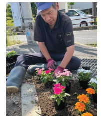
花植え込み作業(栽培)