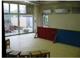
(ペインティングルーム)