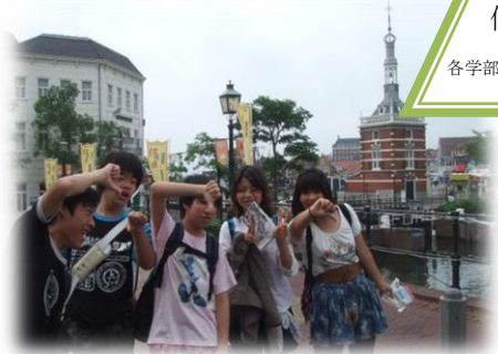
修学旅行 各学部で春・秋に実施