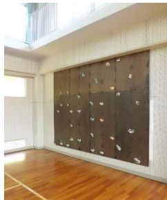
(体育館：ボルダリング)