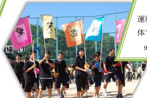
運動会 体育大会 9~10月