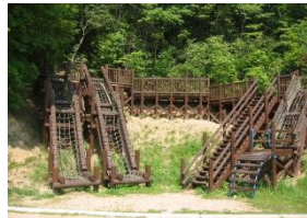
(フィールドアスレチック)