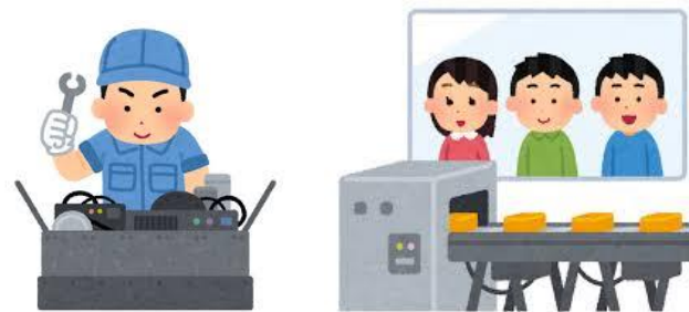
通学バスで訓練校見学