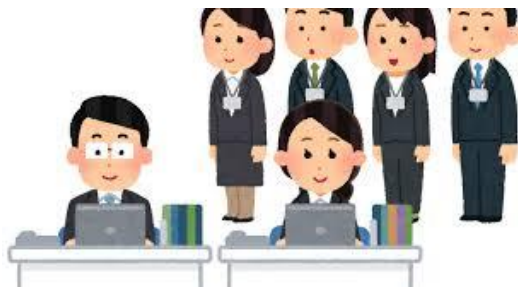
通学バスで企業見学