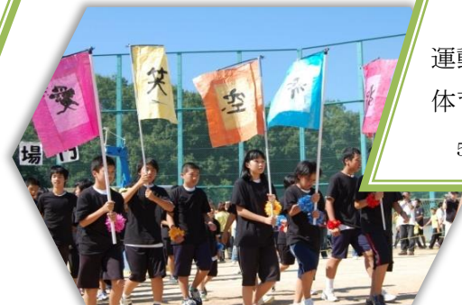
運動会 体育大会 5月