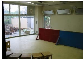
(ペインティングルーム)