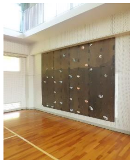
(体育館：ボルダリング)