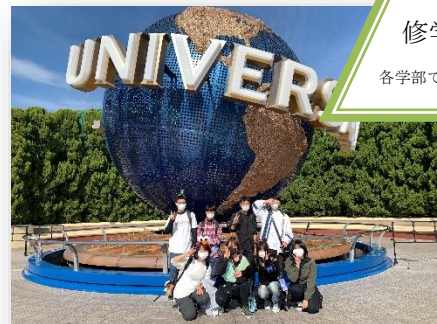
修学旅行 各学部で秋に実施