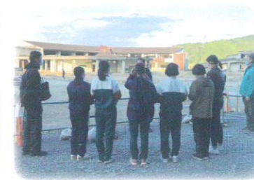
東日本大震災の被災地