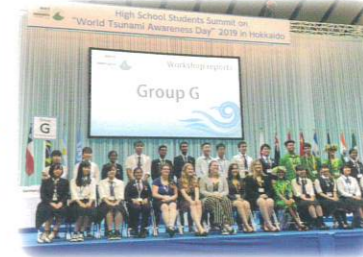
「世界津波の日2019 高校生サミット」