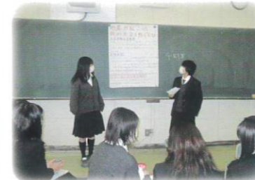
「探究」の授業での取り組み