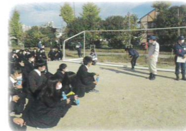
高石市合同避難訓練

高石高校の立地を考え、年に一度、高石市合同避難訓練に参加。「総合的な探究の時間」の授業では、「防災・減災教育」を学習しています。また、大阪代表として研究成果を「高校生サミット」に参加し発表したり、実際に被災地に行き、災害ボランティア研修も行っています。