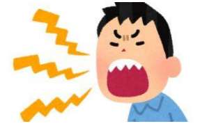
・イライラのコントロール