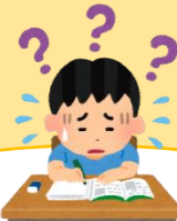
学習への取り組み