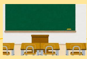
集団活動への参加