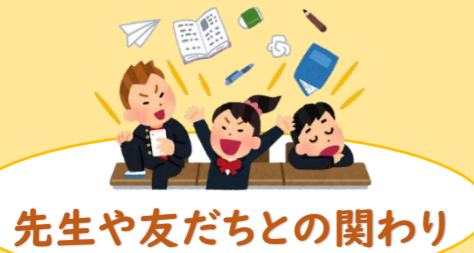
先生や友だちとの関わり