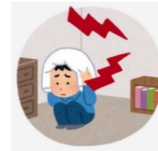
・感覚の鈍感さ、敏感さ