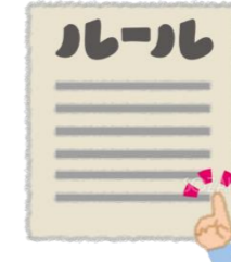
・きまりを守れない