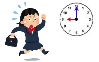
・時間が守れない