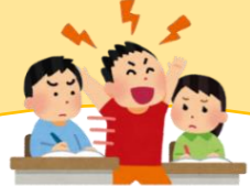
保育への取り組み