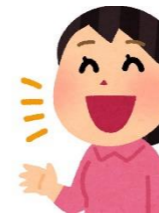
・よくしゃべるのに 学習がすすまない