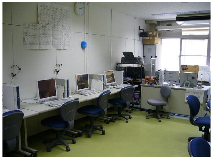
コンピューター室