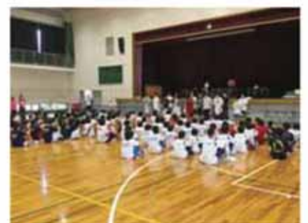
～男子バスケットボールの部～