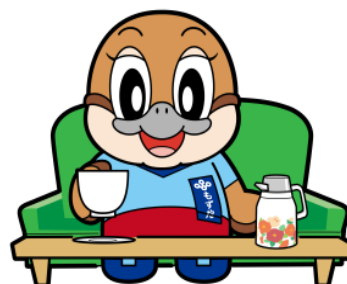
不要不急の外出自粛