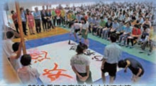
2018.香港の高校生と本校で交流