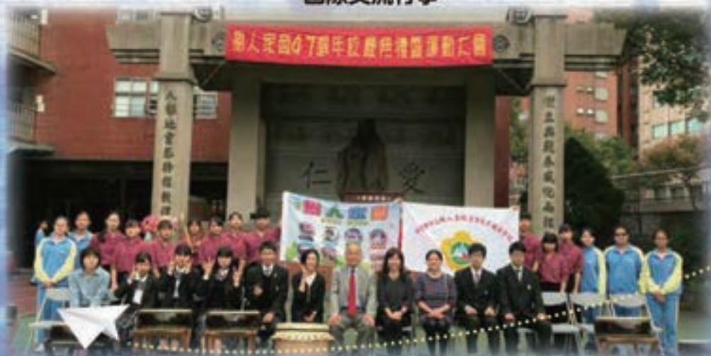
2019.12 台湾新北市 樹人高級家事商業職業学校に代表団を派遣