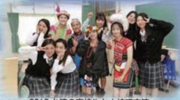
2019.台湾の高校生と本校で交流