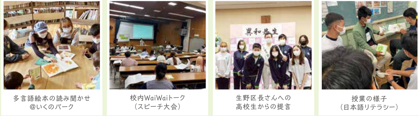
多言語絵本の読み聞かせ @いくのパーク