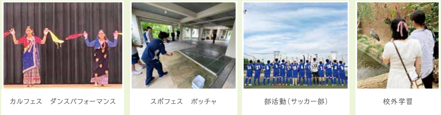
カルフェス ダンスパフォーマンス

年間を通して様々な行事があります。また、時間割や自分のスケジュールに合わせて部活動にも参加できます。