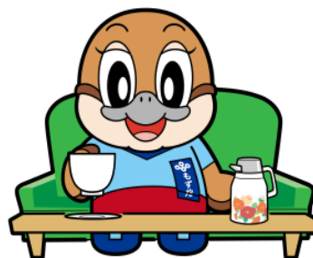
ふようふきゅう がいいつじしゆく 不要不急の外出自粛