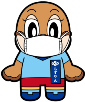
ちやくよう マスク着用