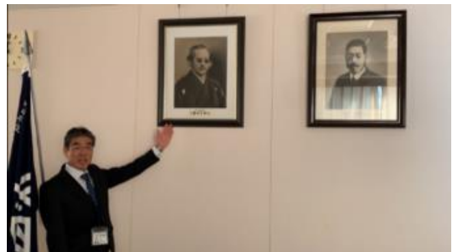
<大阪南からのビデオレターの一部>