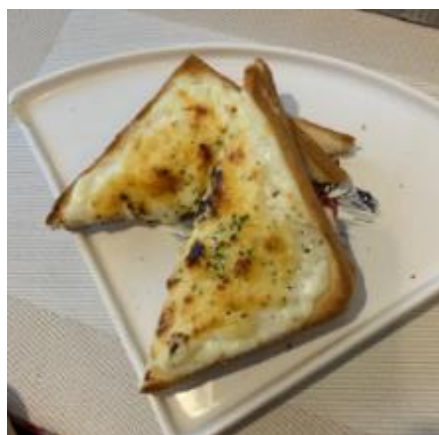
<クロックムッシュ>