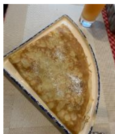
<デザートのカレープ>