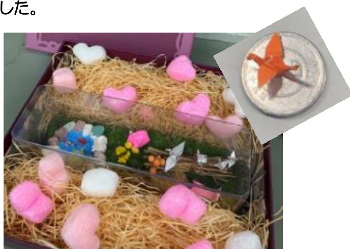
<ミニ折り鶴を含むプレゼント>