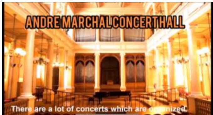
<パリ盲学校からのビデオレターの一部>