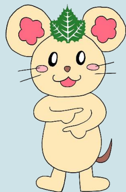
大阪府立中央聴覚支援学校 マスコットキャラクター「すずちゃん」

《大阪メトロ》 「谷町6丁目」駅⑦号出口 北東約600m 「谷町4丁目」駅⑩号出口 南東約600m 《大阪シティバス》 「上本町1丁目」もしくは「国立病院大阪医療センター」下車 http://www2.osdka-c.ed.jp/osakachuo-c-s/