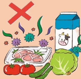
食べ物を常温で 放置しない