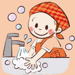
調理・食事前に 手を洗う