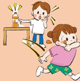
ペットボトル飲料は 早めに飲み切る

湿度や気温が上昇する梅雨の時期は、多くの細菌が好む環境となり、食中毒のリスクが高まります。