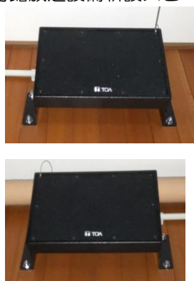
体育館放送設備新設スピーカー