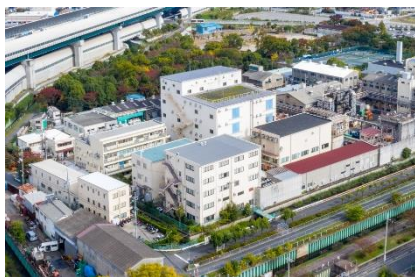
<オリエント化学工業株式会社>

2月5日、総合4班の生徒が寝屋川市にある「オリエント化学工業株式会社」と全国に約3500事業所を持つ「エムサービス株式会社」へ見学に行きました。オリエント化学工業株式会社はボールペンのインクなどを作っておられます。会社の概要を聞き、実際に製品になったボールペンを見せてもらいました。エムサービス株式会社の方からは、実際の食堂の仕事を調理場の外から見学させてもらったり、会社の概要を聞かせてもらったりしました。一度に2社の話を聞くことができ、貴重な時間になりました。