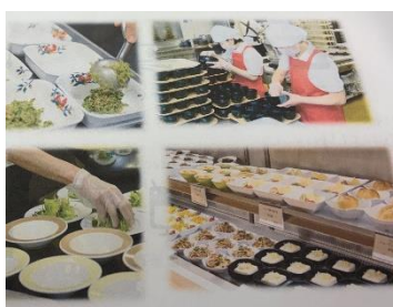
<エムサービス株式会社>