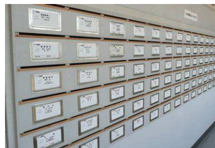
完成したレポートを提出

教科書や学習書に沿った内容の報告課題集(問題集)です。レポートは教科書や学習書を自分で調べ、スクーリングに出席したり、ときには、直接科目の先生に質問したりしながら完成させていきます。レポートの提出は、学校へ郵送する方法と、学校のレポート提出ボックスへ直接投函する方法の2つがあり、添削指導ののち、郵送で返却されます。レポートの内容が合格基準に達していない場合は「再提出」が求められ、「合格」するまで学習を続けていきます。