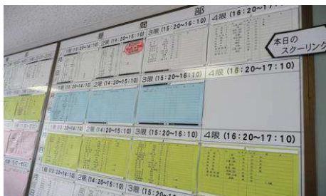
スクーリングボードで予定を確認