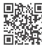
応募フォーム アクセスQRコード