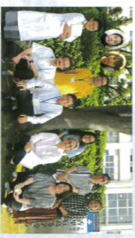
令和2年度 PTA役員のご挨拶

①そのような中で今年度の委員会活動は感染予防を行いつつ適切に行います。 ②同じ学校のPTAとしてこの日常をみんなで見守る方法を模索していきます。