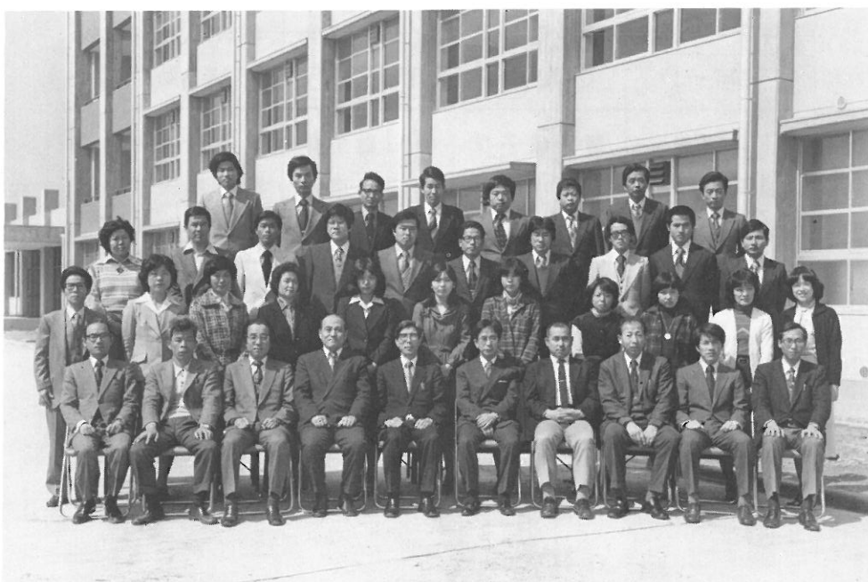
昭和 52 年度 教 職 員