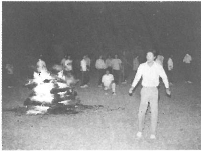
▲ ファイヤーストームを囲んでフォークダンス