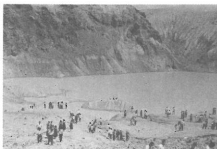
▲ 八島湿原遊歩道にて