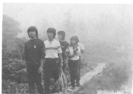
▲ 七色の水面、白根山