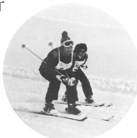
▲ オレは滑降レーサー!

第1日 大阪(ナンバ球場駐車場) = 多賀SA = 松本 = 白馬アルプスホテル 第2日 開講式 講習 第3日 講習 第4日 講習 閉講式 ホテル出発(PM7:30) 第5日 = 恵那SA = 多賀SA = 大阪(AM6:00)解散