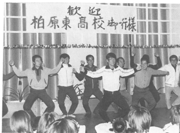
▲ 生徒もこれには負けました!