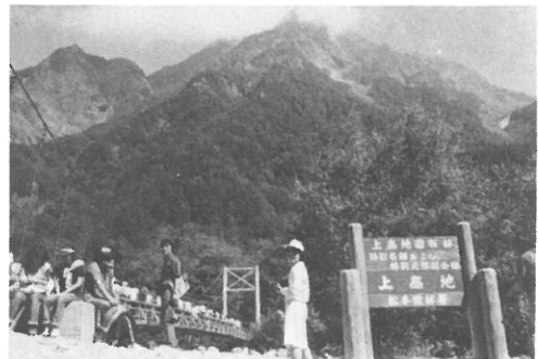
▲ “遠くへ行きたい” 上高地編