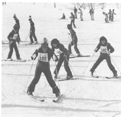
▲ ボーゲンなんて軽いものさ!