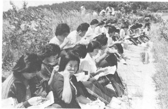
▲ 女神湖のほとりで、ランチタイム