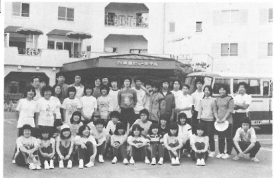
▲ 2-11 大西学級 全員集合！