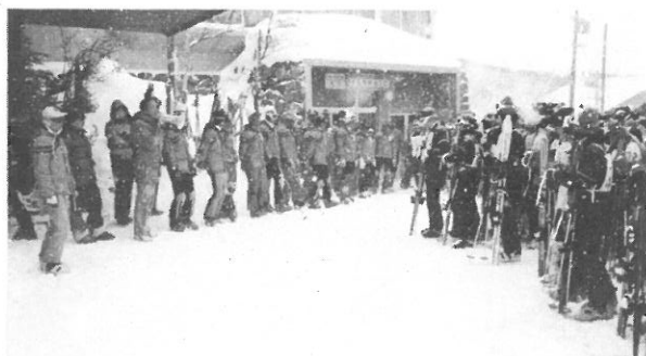
志賀高原スキー場 発哺温泉 天狗の湯