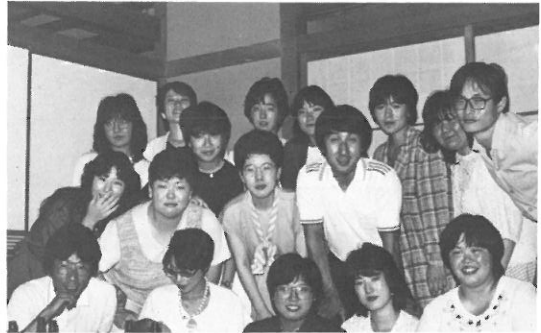
昭和60年5月 美術部OB会

十周年を迎えられ、すばらしい環境の中で、設備も充実し、これからが第二のステップの時期であろうと思います。この十周年を節目に、より一層の躍進を期待しております。