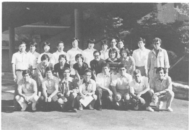
◀ 寝ずの見回り、御苦労様でした。