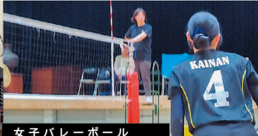
女子バレーボール