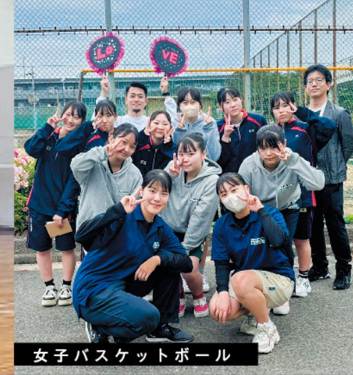
女子バスケットボール