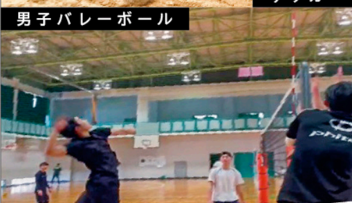
男子バレーボール