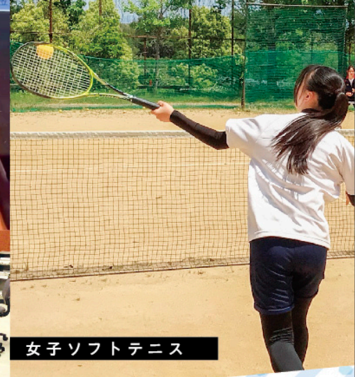
女子ソフトテニス