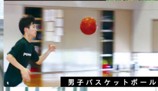
男子バスケットボール