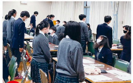
POINT 2 0からの手厚い進路サポート!

進化し続ける貝塚南の行事。楽しく、青春の笑顔がこぼれるのはもちろん。貝塚南の行事の特徴は生徒主体であること。自分たちで作っていくからこそ、企画力・協働力が身に付き、一生の思い出になります!