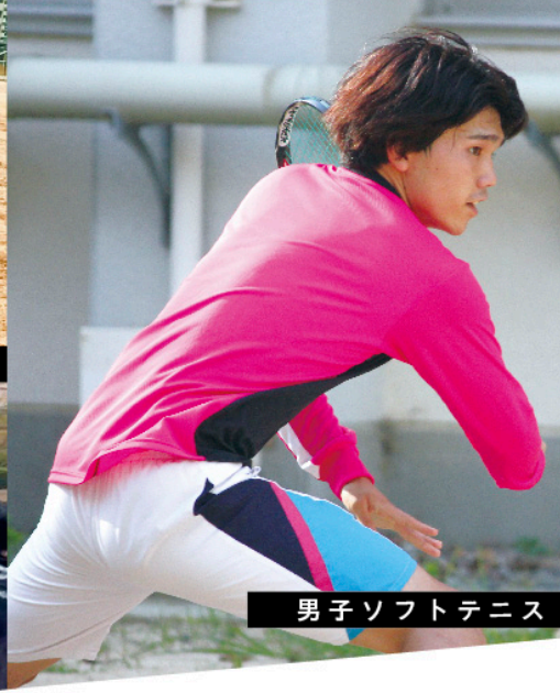
男子ソフトテニス