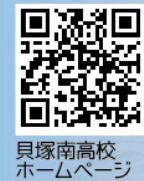
貝塚南高校 ホームページ

大阪府立貝塚南高等学校 〒597-0043 大阪府貝塚市橋本620 TEL.072-432-2004 FAX.072-432-5278