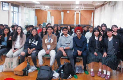
POINT 3 チャレンジの選択肢が多い!

貝南生の進路先は多岐にわたっているからこそ、どんな希望に対しても手厚いサポート!希望の進路探しから、面接練習・書類添削、そして希望者への進学講習も充実しています。自分にあった進学先、受験方法を決めることができます!