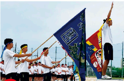
POINT 1 生徒が作る学校行事!

進化し続ける貝塚南の行事。楽しく、青春の笑顔がこぼれるのはもちろん。貝塚南の行事の特徴は生徒主体であること。自分たちで作っていくからこそ、企画力・協働力が身に付き、一生の思い出になります!