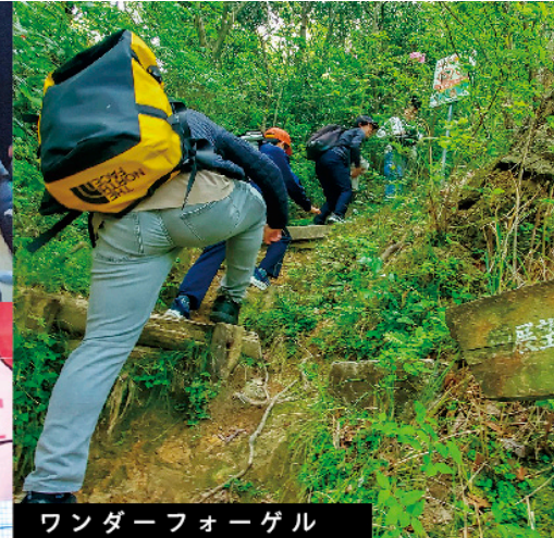
ワンダーフォーゲル