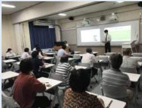
インターシップ発表会