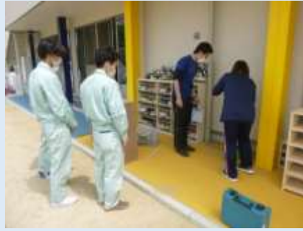
テクノボランティアによる地域連携