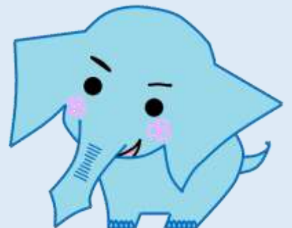
和泉総合高校 マスコットキャラクター 『イズゾ〜』