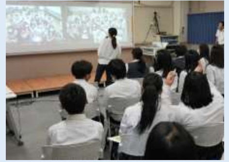
韓国の高校とオンライン国際交流