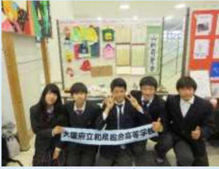
近畿総合学科研究発表大会に出場 (令和元年度)