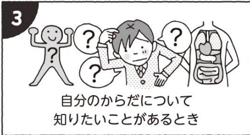
自分のからだについて 知りたいことがあるとき