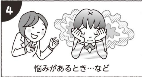
悩みがあるとき…など