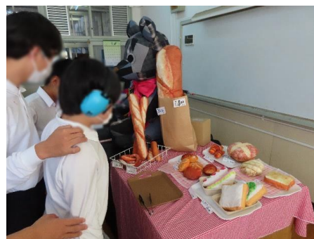
本校作品展示の様子

中学部2年生は作品出展鑑賞に加えて、体育館で舞台発表をしました。舞台発表の前半は、代表の生徒がプレゼンテーションソフトを使って、写真を提示しながら学校生活の様子を紹介しました。後半は、運動会で行ったリズム体操を披露しました。お互いの生徒が「エイエイオー！」と大きな掛け声を出し合うことで、一体感を味わうことができました。