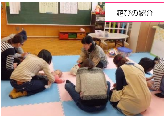
【赤ちゃん組 ふれあい遊び】

一人ひとりのお子さんの発達に合わせ、親子での通じ合いを促し、遊びやコミュニケーションを深めていけるように、お遊戯や手遊び・絵本・季節を感じる活動を紹介します。