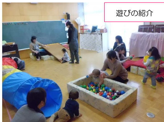
【1歳児クラス サーキット遊び】