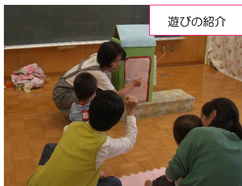
【1歳児クラス おはなし遊び】

子どもたちだけでなく、お母さんやお父さんが仲間と出会う場でもあります。おじいちゃんやおばあちゃんも是非お越しください。この時期だからこそその子育てをみんなで楽しみましょう。