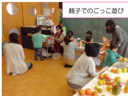
【2歳児クラス 買い物ごっこ】