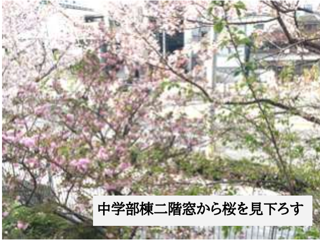
中学部棟二階窓から桜を見下ろす