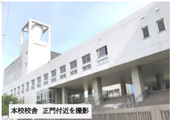
本校校舎 正門付近を撮影

いと思います。始業式では、 幼稚部、小学部、中学部が体育館 にそろい、全員で校歌を歌うこと ができました。幼稚部2、3年生 にとっては、初めての集合形式 となります。お兄さんお姉さんが たくさんいることを体感できたこ とでしょう。今年度の幼児児童 生徒数は合わせて107名となりま した。私からは「みんなで仲良 く素敵な学校を作りましょう」と 挨拶しました。子どもたちは大き くうなずいたり、返事をしてくれ たりと、とても頼もしく感じまし た。 新しい学年がスタートし、子 どもたちは学習や行事などへの 期待で胸がいっぱいに見受けられ ます。 一人ひとりが毎日元気な笑顔を 見せて登校してくれていることを