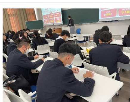
進路フィールドワーク(11月)