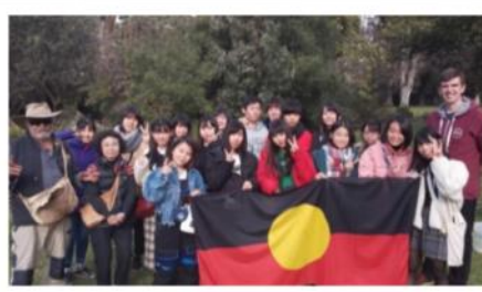
海外語学研修 (隔年実施 今年度夏休み復活予定)