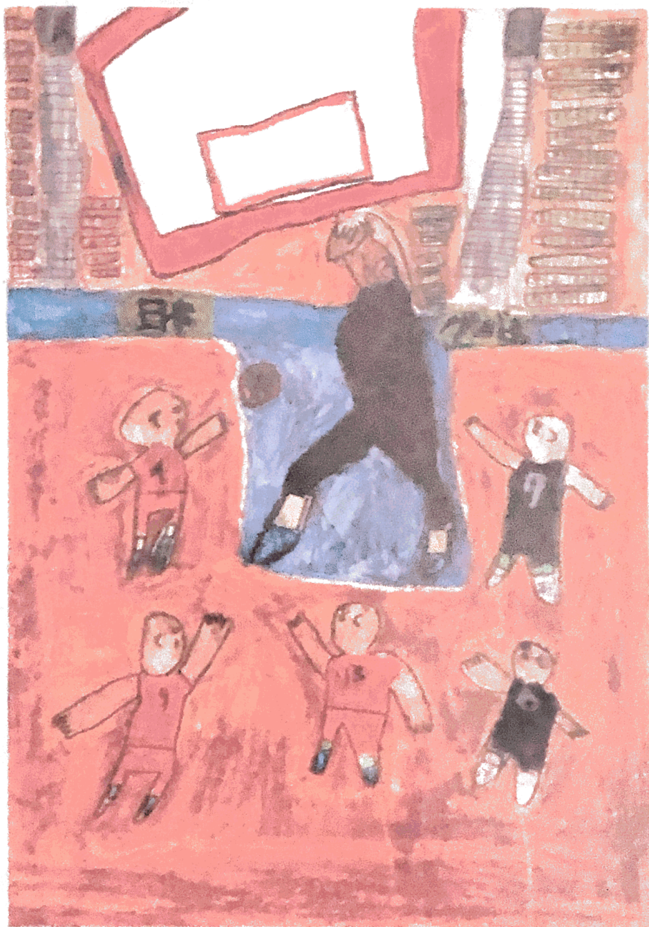
第38回肢体不自由児・者の美術展入賞作品「バスケット」