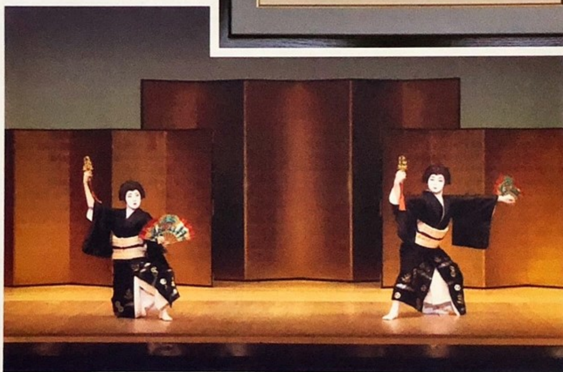
提供：正派若柳流若柳会「創作 三番叟」