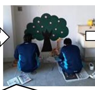
おそらく冷水器だったと思われる配管の跡を、高等部造形部の生徒たちの手により、むき出しの配管がキリンに変わりました。

このように学校の隅々に、手作業で、いろいろな掲示などをわかりやすくするため、楽しく遊び心いっぱいにデザインされています。また学校にお越しの際は校内のデザインに注目してみてくださいね！