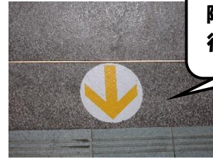
階段も左側通行で