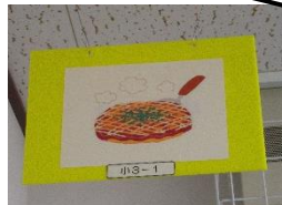
教室掲示も遊び心いっぱい