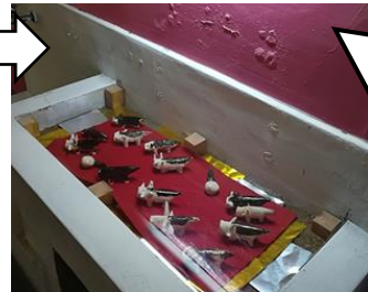
現在は使用できなくなった水道跡 周りをペンキで塗り、高等部生徒作成の「いのししの置物」を飾りました。