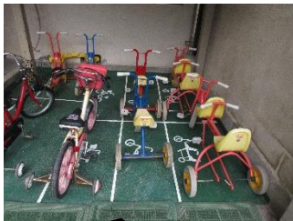
自転車の収納スペースも一目瞭然