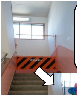
屋上出入口の立入禁止のフェンス青いペンキでフェンスを塗り、高等部生徒の作品を飾りました。