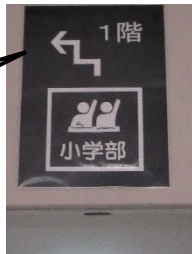
小学部はこちらです！