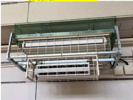
体育館のエアコン