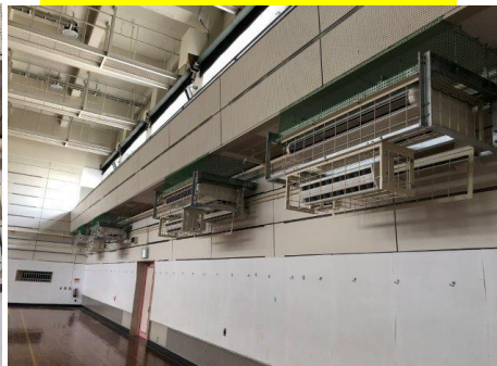
体育館～8基設置しています