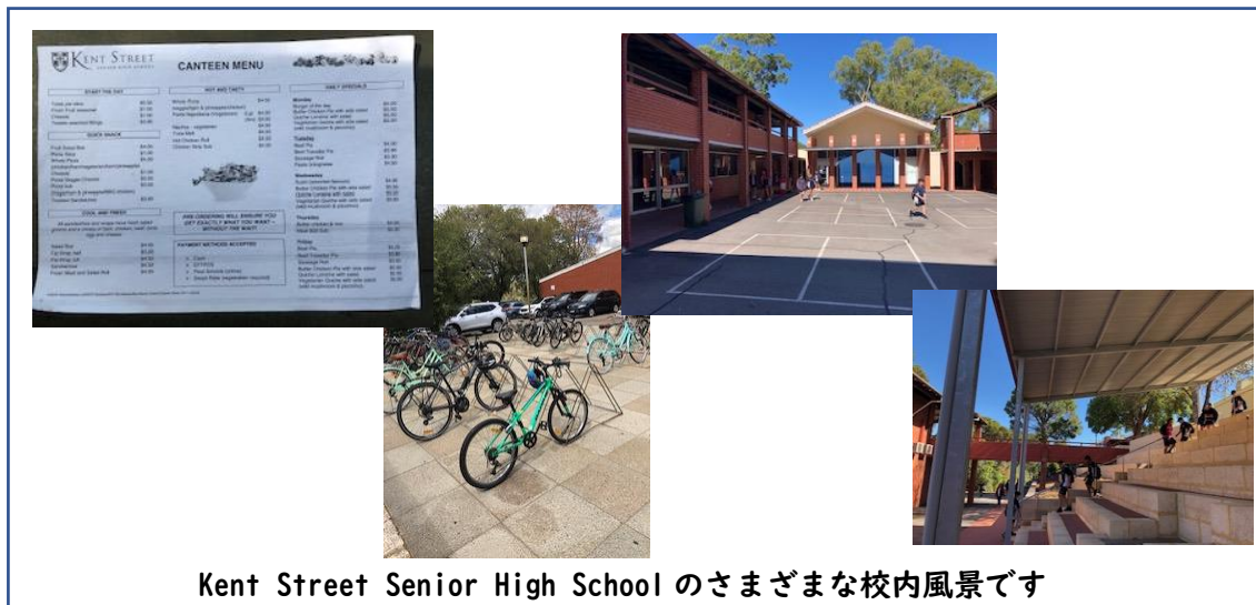
Kent Street Senior High School のさまざまな校内風景です