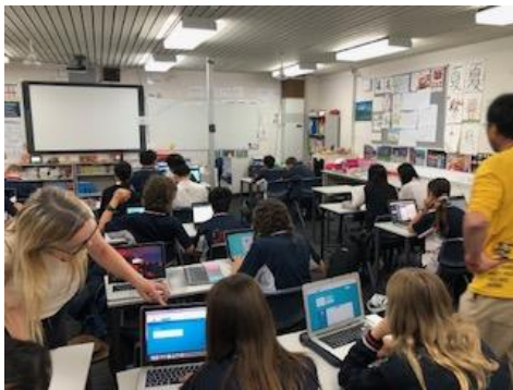
コンピュータを利用した授業