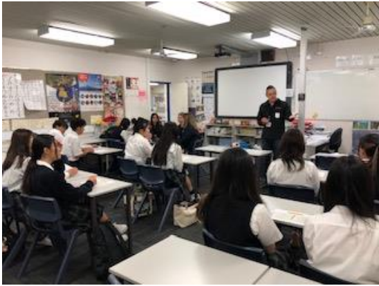
まず最初にオリエンテーションです