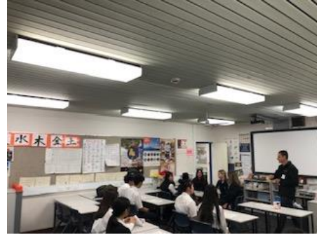
日本語を学ぶ授業があるので、 掲示物に日本語で書かれたものがあります