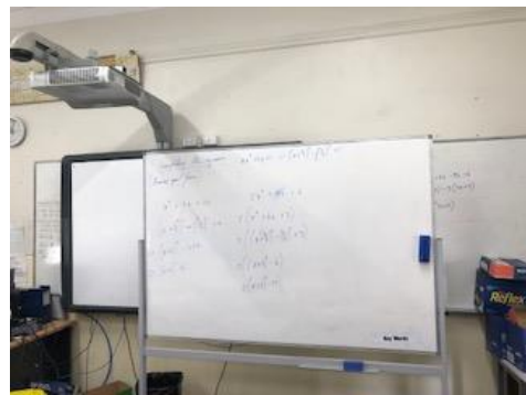
数学の授業にも参加