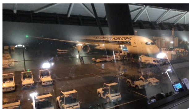
シンガポール航空を利用します