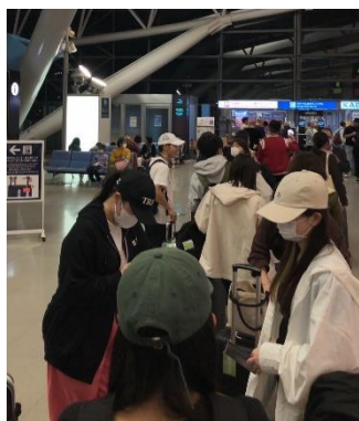
関西空港での航空会社の check in の列です （多くのお客様が並んでいます）