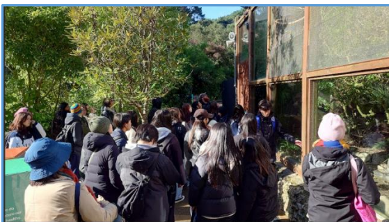
⑰ ニュージーランド固有種の"ケア"にも会えました