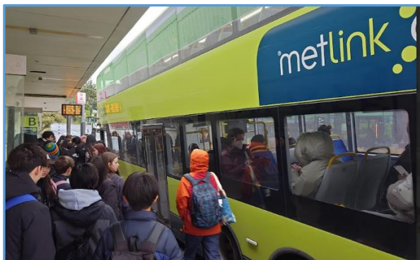
⑭ 今日は Wellington Zoo に遠足へ行きました バスの手すりも黄色でおしゃれですね