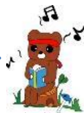
訪問教育 キャラクター ハミングバア が答えます。

学習や生活において、みなさんに習得してほしい力を伸ばしていく活動です。教科学習や休憩時間の活動を通して取り組んでいます。