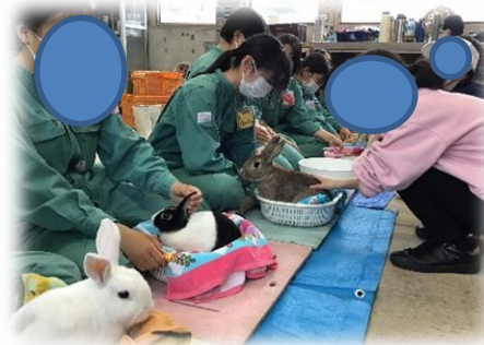
校外活動（ふれあい動物園）