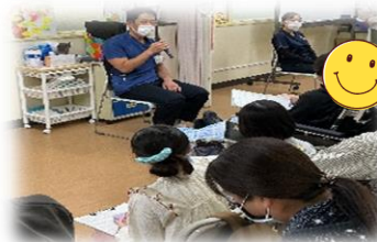
病院ではたらく人にインタビュー