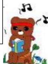
訪問教育キャラクター