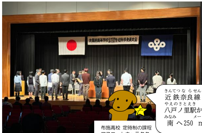
布施高校 定時制の課程 マスコットキャラクター 『フセッティ』

10月20日(日)に大阪府教育センターにて生徒秋季発表大会が行われました。本校からは絵画の部、写真の部、書道の部、生活体験発表の部とたくさんさんの生徒が活躍してくれました！！