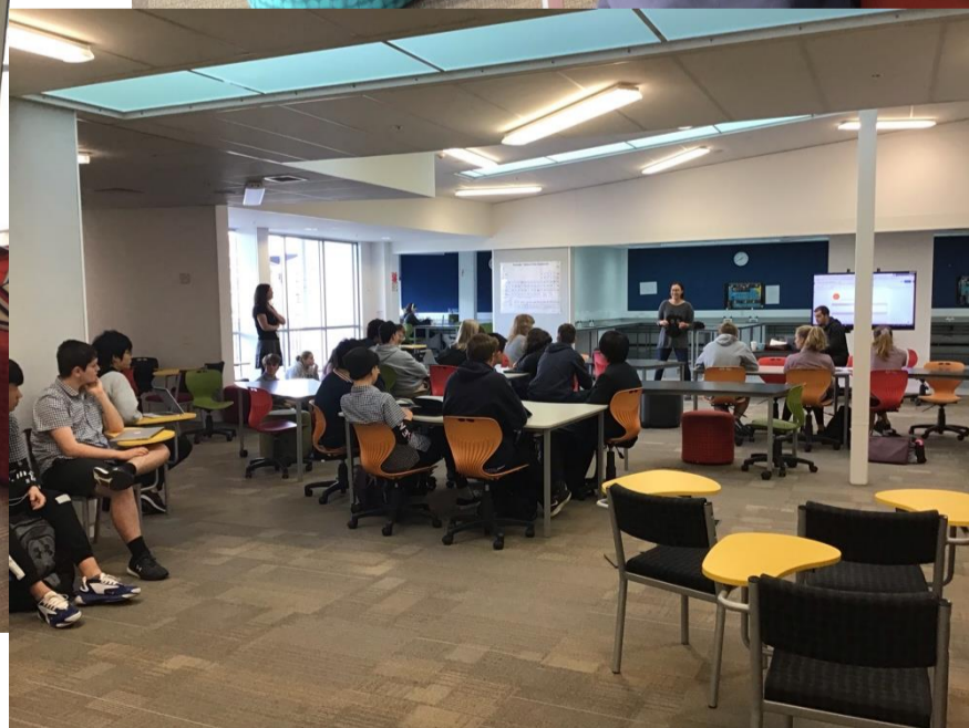
ランチタイムのひと時です ↑