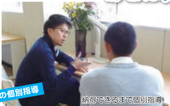
納得できるまで個別指導