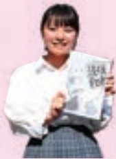
漫画・アニメ研究部