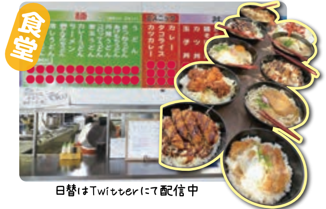
日替はTwitterにて配信中