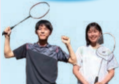
男・女バドミントン部