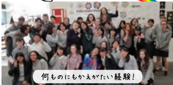
何ものにもかえがたい経験!