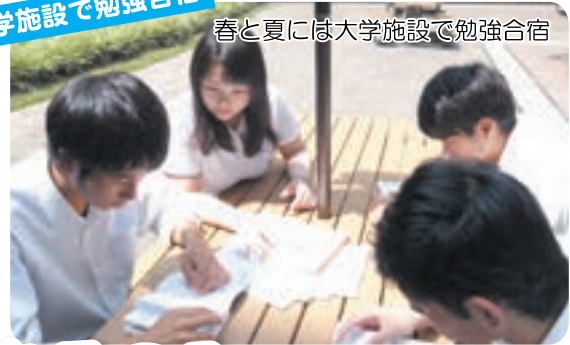
春と夏には大学施設で勉強合宿