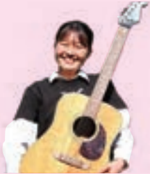
フォークソング部