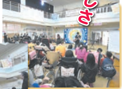
音楽を通して 心の通い合い