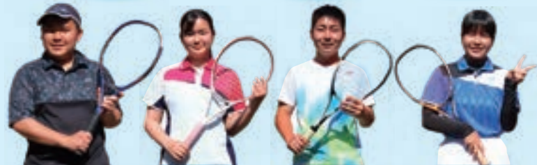
男・女硬式テニス部