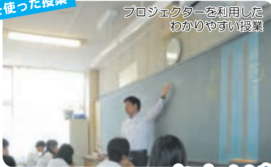
プロジェクターを利用した わかりやすい授業