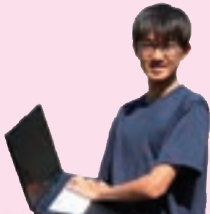
マルチメディア部