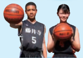
男・女バスケットボール部