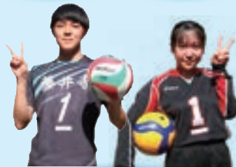
男・女バレーボール部