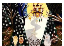
[場面別のボードにはめる背景]