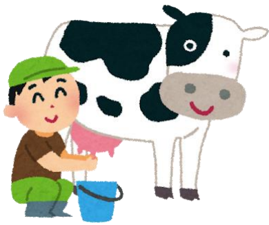
うし そだ 牛を育ててくれる人