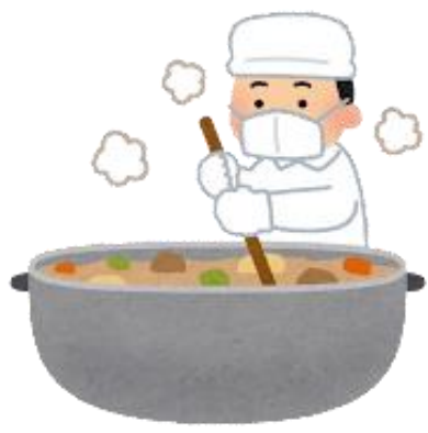
しょくじ つく 食事を作ってくれる人

かか 関わっている たくさん の 人 に 感謝 の 気持ち を 込めて、 「いただきます」と「ごちそうさま」をいましょう。