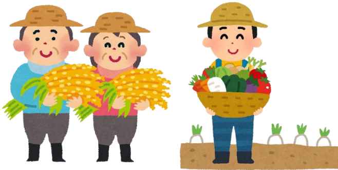
こめ やさい つく 米や野菜を作ってくれる人

わたし た が食べている 学校 給食 は、たくさんの 人 たちに 支えられて 作られて います。 感謝 をしながら 給食 をいただきますよう。