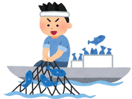
さかな 魚をとってくれる人