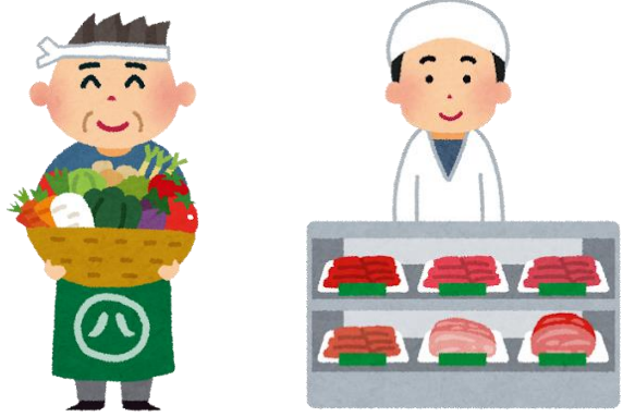
た もの う 食べ物を買ったり、 はこ 運んだりしてくれる人