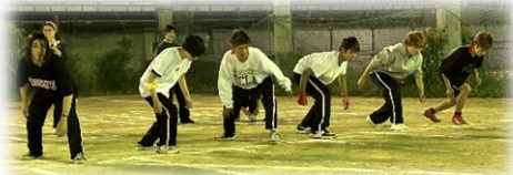
俊足 No.1 に輝いたのは・・・？