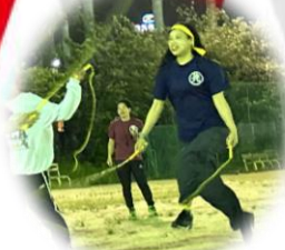
先生達も参加！やるからには真剣！！