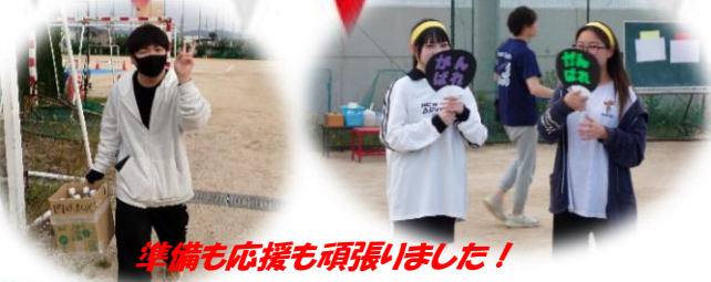
準備も応援も頑張りました！