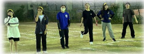
借り人、パン食い、三輪車、アスレチック・・・競技盛りだくさん！？