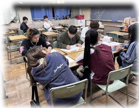
教室でルール作り