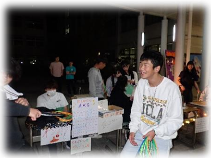
呼び込み頑張りました！