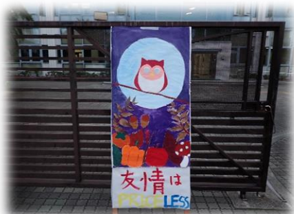
生徒会の看板でお出迎え！