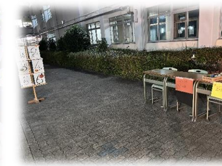
3-2 ストラックアウト