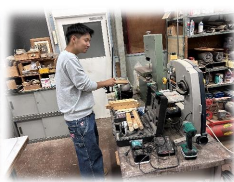
輪投げの支柱を削っています！