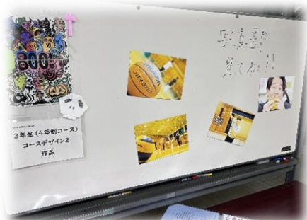
写真部のコーナーも