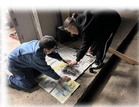
ボードにラッカーで着色！