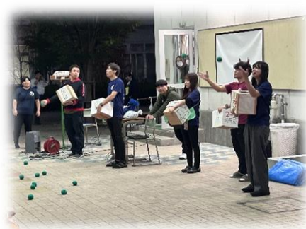
看板投票を玉入れ形式で発表！