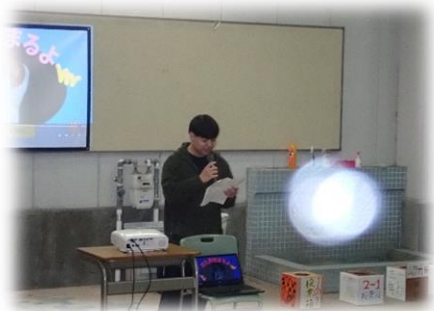
生徒会の司会で開幕！