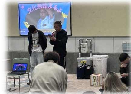
1年生の企画アピール